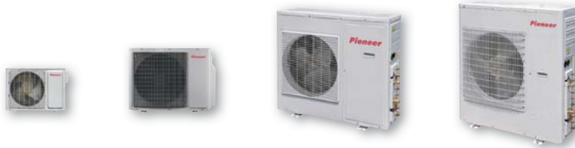
Технические характеристики на наружные блоки